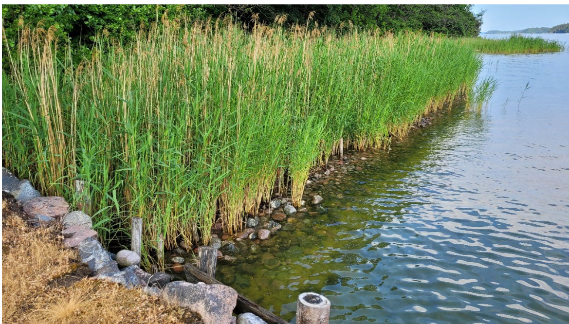
Figur 3. Vågdämpande barriär och återetablering av vass vid Kopparnäs, Furusundsleden i Stockholms skärgård.