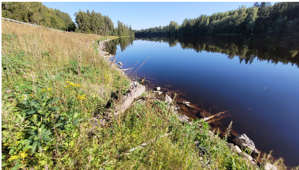
Figur 2. Naturbaserad erosions- och släntstabiliserande åtgärd längs väg 62 i Värmland, Karlstads kommun.

floran på platsen. Bilden visar hur skyddet såg ut redan det första året - en helt vegetationsklädd yta. Träd har planterats och kommer växa upp med tiden.